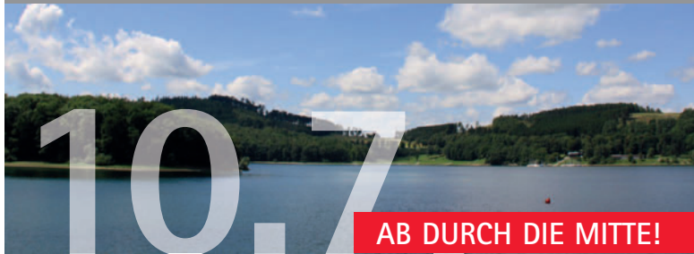
Altena; Foto: Südwestfalen Agentur